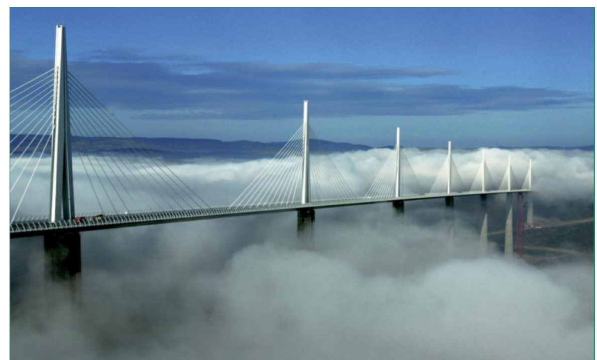
(Zie: Ruggengraat voor het klimaat, Henk Diepenmaat, contact: www.henkdiepenmaat.nl )

Maatschappelijke innovatie is minstens even ingewikkeld als het voorbereiden, ontwerpen, realiseren en onderhouden van de brug van Millau. Het vergt overzicht, doorzicht, inzicht en intense samenwerking op een hoog professioneel niveau. De slaagkans is laag als we dat niveau niet met elkaar weten te realiseren. Maar als we de brug van Millau kunnen realiseren, kunnen we ook maatschappelijk innoveren. Multi-actor procesmanagement draagt hieraan bij.