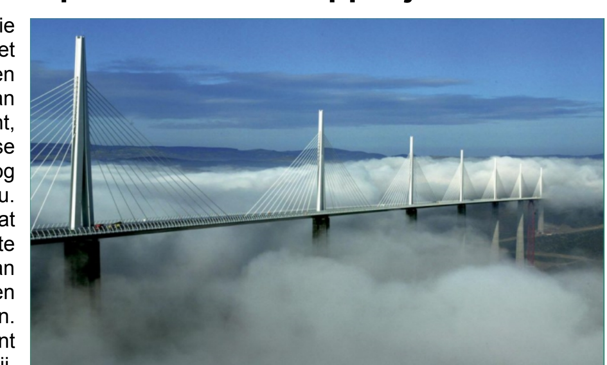
(Zie: Ruggengraat voor het klimaat, Henk Diepenmaat, contact: www.henkdiepenmaat.nl )

Maatschappelijke innovatie is minstens even ingewikkeld als het voorbereiden, ontwerpen, realiseren en onderhouden van de brug van Millau. Het vergt overzicht, doorzicht, inzicht en intense samenwerking op een hoog professioneel niveau. De slaagkans is laag als we dat niveau niet met elkaar weten te realiseren. Maar als we de brug van Millau kunnen realiseren, kunnen we ook maatschappelijk innoveren. Multi-actor procesmanagement draagt hieraan bij.